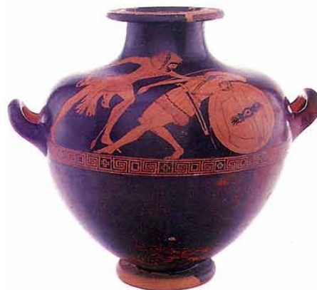
Kalpis figurata da Fratte

Le campagne di scavo effettuate a Fratte di Salerno, iniziate nei primi anni del Novecento, attestarono senza dubbio l'esistenza di un importante centro arcaico, certamente anteriore alla colonizzazione romana, localizzato proprio allo sbocco della stretta valle dell'Irno. Nella zona le scoperte archeologiche si sono susseguite frequenti nel corso degli anni, portando al rinvenimento di una necropoli etrusco-sannitica, di un acropoli con resti di edifici sacri, di un quartiere artigianale nonché di numerosi manufatti, tra cui iscrizioni in lingua etrusca (ma anche greca ed osca).